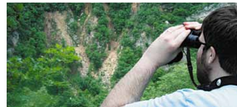
Uno sguardo su Fossa Campana. Looking at Fossa Campana.

Il percorso ha inizio dal parcheggio della biglietteria delle Grotte di Stiffe e dopo circa un chilometro in leggera salita, si raggiunge una dolina denominata "Fossa Campana".