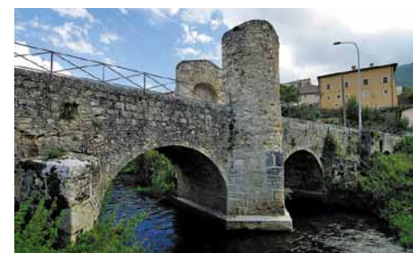
Il ponte medioevale. The medieval bridge.

The trail continues downhill as far as Campana (a district of the municipality of Fagnano Alto), offering a view of a fine medieval bridge.