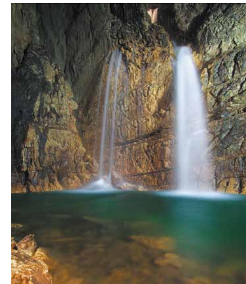
La grotta di Stiffe. Stiffe caves.

L'immensa voragine è il risultato del crollo di antiche caverne di origine carsica e ha un diametro di 300 m e una profondità di 100 m; nella stagione calda, inoltre, l'intera dolina si ricopre di un'ampia vegetazione che la rende alquanto mimetizzata al visitatore. Sul fondo poi, nel lato nord-ovest, un ulteriore sprofondamento conico dimostra che la zona è ancora interessata da movimenti sotterranei. Il sentiero prosegue in discesa fino alla frazione di Campana, nel comune di Fagnano Alto, da cui è possibile ammirare lo splendido ponte medioevale. Prima del ponte si gira a sinistra e si costeggia il Rio Gamberale per circa 1 km su sentiero pianeggiante fino a tornare al punto di partenza. Qui giunti, meritano una visita le famose Grotte di Stiffe: cavità carsica dove è possibile ammirare i salti d'acqua e le cascate originatesi dal fiume perenne. Le grotte sono infatti una risorgenza del fiume, cioè il punto dove questo torna alla luce dopo un tratto sotterraneo.