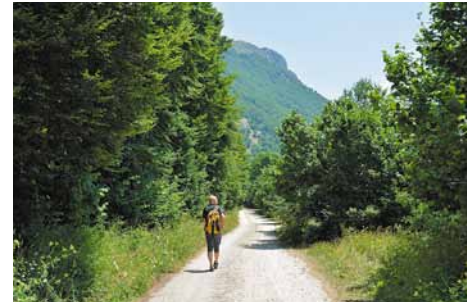
Lungo il percorso sotto la faggeta. Along the path, under the beech trees.

A circa 2,5 km da Ovindoli, in direzione sud-est, troviamo la Valle d'Arano, parte integrante del Parco Regionale del Sirente-Velino. È un antico bacino lacustre, originato dal torrente La Foce, che ha dato vita anche alle Gole di Celano-Aielli, canyon naturale tra i più suggestivi d'Italia. Nella valle si sviluppa un anello percorribile con facilità sulla pista ciclo-pedonale di recente realizzazione, quindi adatta anche ai passeggini.