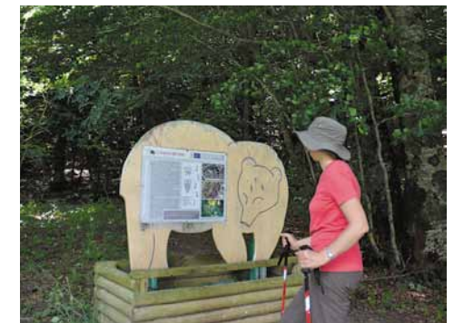
Cartello informativo del Parco. Park information panel.

The second part of the itinerary winds through woods that are mainly hazelnut.