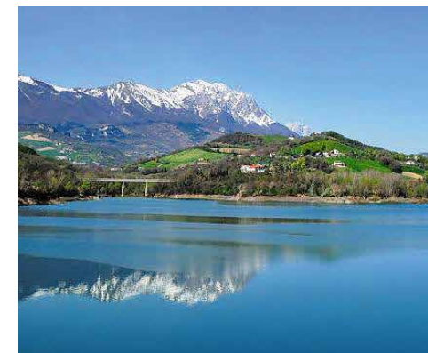
Il lago di Penne. Lake Penne.

Il percorso si snoda all'interno della Riserva Naturale Regionale "Lago di Penne".