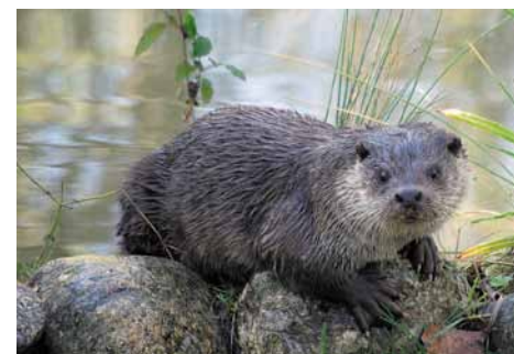
La lontra. The otter.

Si percorre il sentiero per 1,2 km fino ad arrivare al Centro di Educazione ambientale A. Bellini dove è possibile visitare il laboratorio di falegnameria, il laboratorio di trasformazione di prodotti agricoli, la fattoria didattica e il piccolo osservatorio astronomico. Il ritorno sullo stesso percorso.