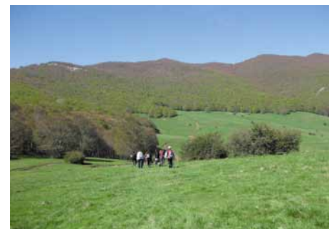
Lungo il sentiero. Along the trail.

La Piana del Voltigno è un incantevole altopiano di origine carsica sito nella parte orientale del Gran Sasso. La vallata fa parte del Parco Nazionale del Gran Sasso e Monti della Laga e costituisce, dal 1989, insieme alla Valle D'Angri, la Riserva regionale "Voltigno e Valle D'Angri".