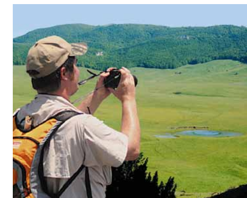
Guardando il lago Sfondo. Looking at lake Sfondo.

We return to the starting point via the artificial lake and skirting Lake Sfondo (1,361m).