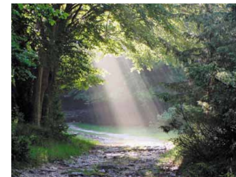
Suggestivo scorcio dopo un temporale. Charming view after a thunderstorm.

Continuing on the path, it will take us an hour to an hour and a half to reach the Orso Pass, used for centuries by shepherds to cross into the region of Lazio. Here a large clearing offers the chance to observe deer, roe and, with some luck and attention, even a bear, especially if we have binoculars to help out. For those who enjoy hiking, the trail can be extended as far as the Forca Resuni refuge (1,931 m), to the left, taking in Tre Confini, on path 04, then continuing on path 05. The return is along the same route.